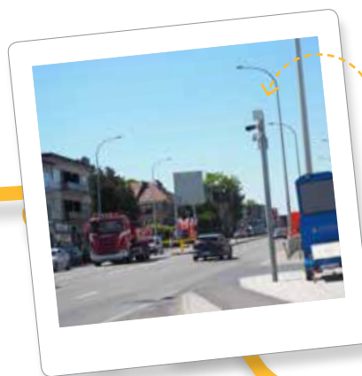
12 ANPR op N8